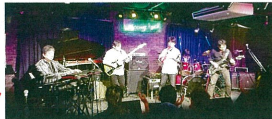
Acoustique IN mode