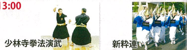
少林寺拳法演武 新粋連