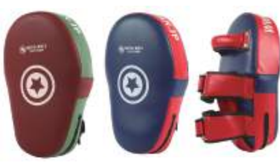
パーガンディー/カーキ