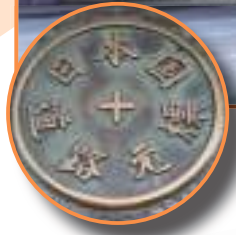
← 日本橋の中心に実際に埋め込まれているよ！

とうきょうと にほんばし ちゆうしん う 東京都、日本橋の中心に埋め こ 込まれた「日本国道路元標」。 えどじだい げんざい にほんばし 江戸時代から現在まで、日本橋が ぜんこく とうろく きょり はか 全国の道路の距離を測るはじまり となっています。