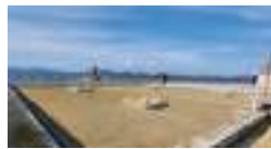
宇多津町の海岸に復元された『入浜式復元塩田』

瀬戸大橋が架かっている宇多津町は、元々塩田が盛んだった町です。今の街並みからは想像できないですが、海岸に行くとも今でもその名残があります。本部にお越しの際には、是非探してみてください！