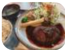
お気に入りカフェの「つやつやなハンバーグ」

涼しい風と穏やかな日差し。一番好きな季節の秋がやってきました。秋晴れの日は、大学時代にハマった「サカナクション」の音楽を無性に聴きたくなるのです。(エモい)——かわいいことを見つけては、Twitterで発信中。映画鑑賞記録はFilmarksにて。