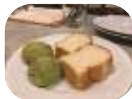
お洒落なタパスバーで出された「小さなパンのお通し」