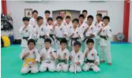
愛媛県 新居浜瀬戸道院拳友会