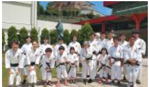
石川県 金沢中村スポーツ少年団