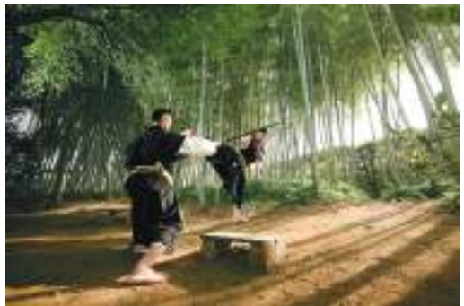
ロケ地 中津万象園