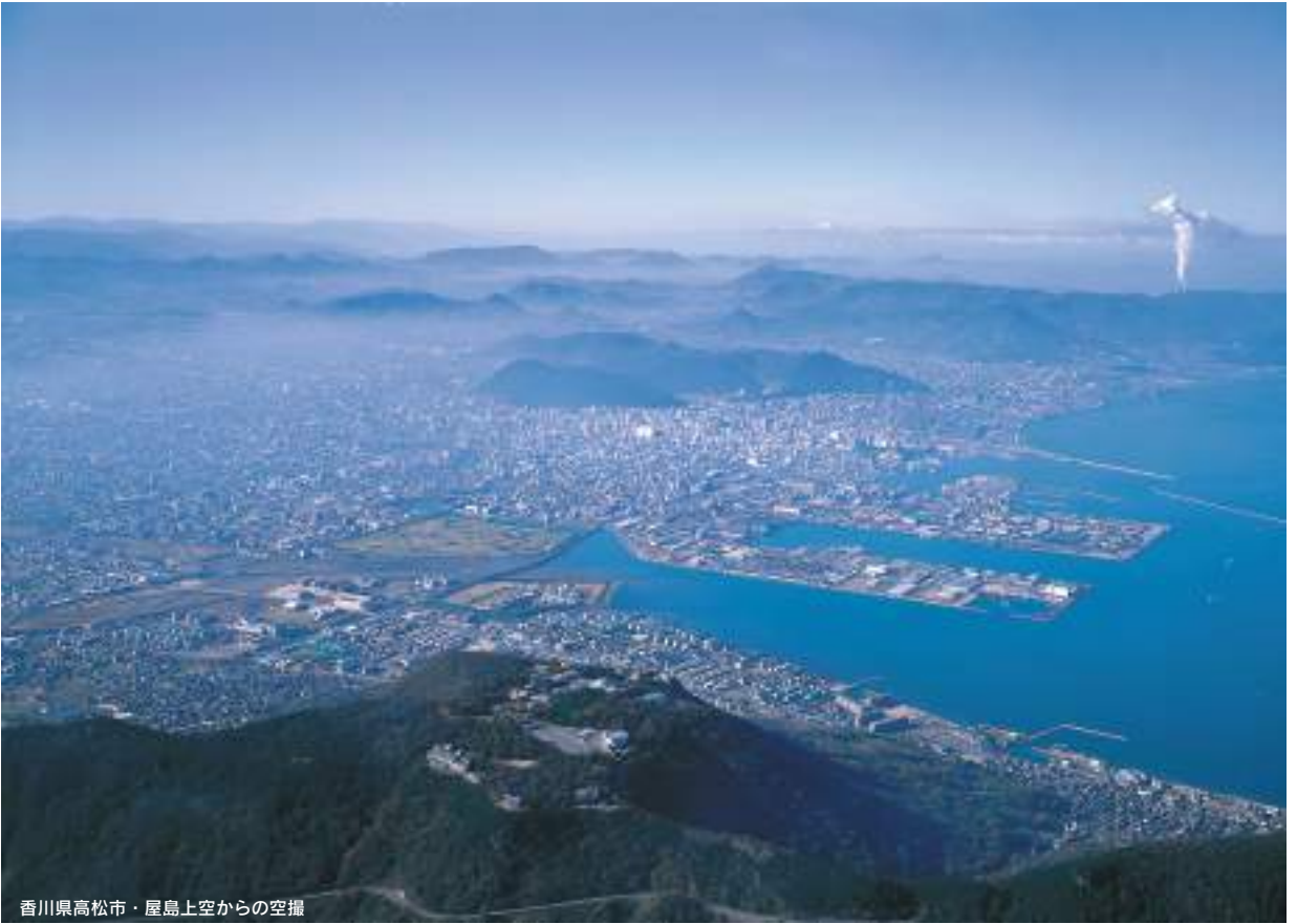
香川県高松市・屋島上空からの空撮