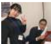
畔蒜 みく 振興普及部

創業から90年におよぶ歴史の 中で生まれたキャラクターは、 なんと1,000を超えるそう。 キャクターの数だけ人々に癒 しとステキな思い出を届け続け てきたサンエックス株式会社、 歴史とパワーと努力に心を揺さ ぶられた、夏のできごとでした。