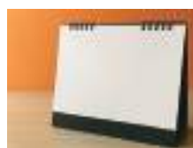
卓上サイズ (155 × 180 × 13 枚綴)