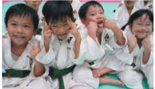
香川県 タドツスポーツ少年団