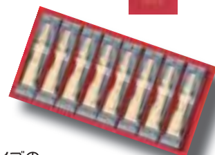
写真は個人で購入後撮影したものです。