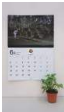
A3 サイズ (A4 × 2 頁 × 12 ヶ月綴)

カレンダー PROJECT2023 も、いよいよ大詰め。【皆さまから募集した笑顔写真】と【撮りおろし写真】、それぞれ選定した写真を発表いたします! カレンダーのサイズはA3と卓上の2種類。それぞれ数に限りがございますので、お早めにご注文ください!!