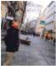
執筆者 / 谷 聡士